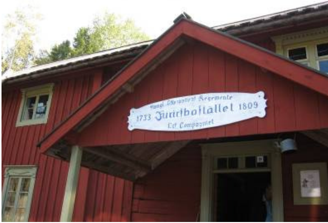
Furirbostället i Oravais