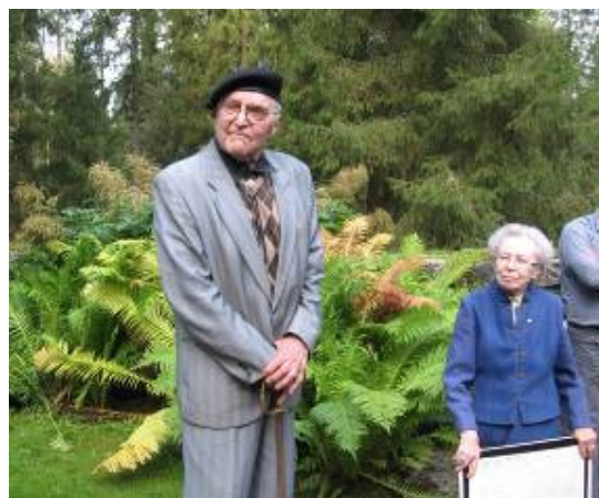
Minnesstenen vid Napo

Höjdpunkten under historiedagarna var utflykten till Storkyro och Oravais' slagfält. Storkyro är platsen där det blodiga klubbekriget utspelades under slutet av 1500-talet och på en ö strax utanför kyrkan avrättades upprorsmännen. Gruppen blev guidad av vad som säkert var en veteran från världskriget vilken tillsammans med sin åldriga hustru berättade om kyrkans märkliga målningar från 1300-talet och sedan följde med vidare till minnesstenen vid Napo där Stora nordiska krigets sista fältslag utkämpades.